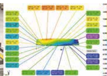
Контроль на производственной линии